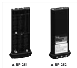
▲ BP-251 ▲ BP-252

BP-251 BOITIER PILES Boîtier pour 5 piles alcaline AAA (LR03) Puissance 2 W.